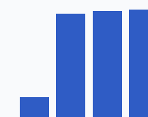
Налог, нагрузка, %