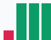
Доля НДС к выручке, %