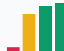
Значение ФОТ в выручке, %