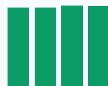
Доля НДС к выручке, %