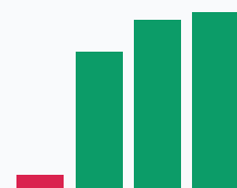
Доля СВ в выручке, %