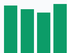
Доля НДС к выручке, %