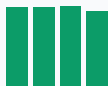
Доля СВ в выручке, %