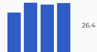
Налог, нагрузка, %