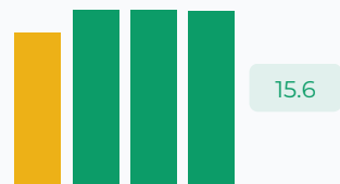
Доля НДС к выручке, %