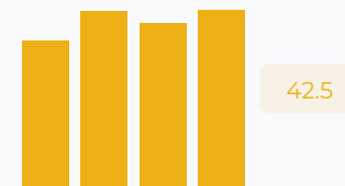
Значение ФОТ в выручке, %