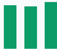
Доля СВ в выручке, %